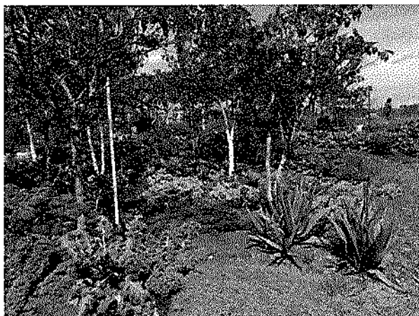
Huerta Comunitaria Guerreras y Guerreros. Beneficiarios convenio 555/2021.

comercialización, logística, acompañamiento en campo a las huertas, agregación de oferta, gestión comercial, apoyo logístico (transporte), entrega de elementos para el mejoramiento de las capacidades comerciales, entre otras actividades.